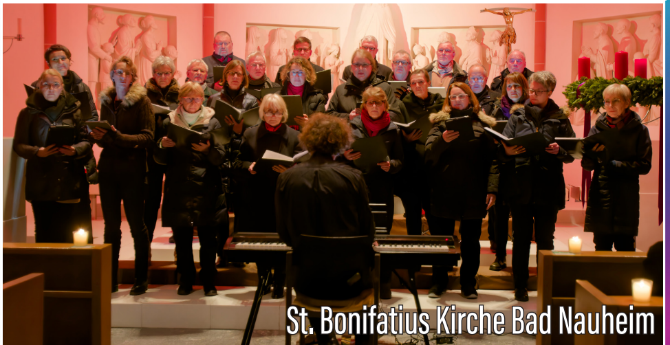
St. Bonifatius Kirche Bad Nauheim